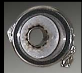
Fig. 2 Indvendig side Udgangsdæl..