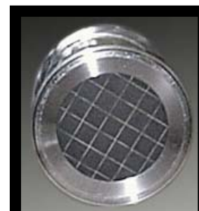
Fig. 1 Filter udgang.